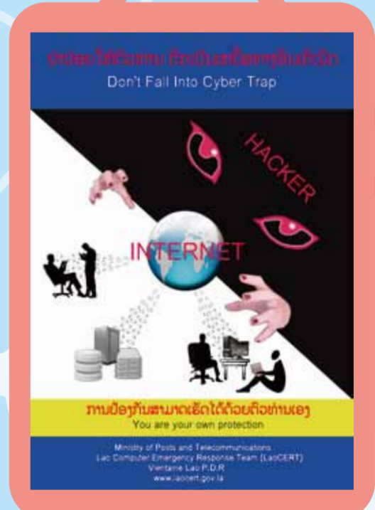
ຮູ້ທັນ, ປ້ອງກັນ, ລະມັດລະວັງ