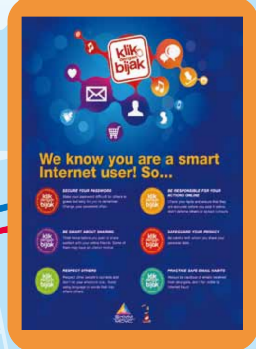
Peka, Selamat, Waspada