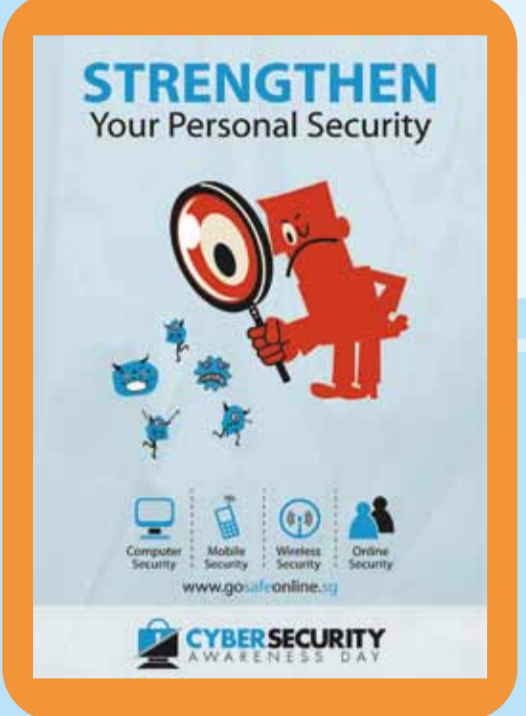
Be Aware, Secure, and Vigilant.