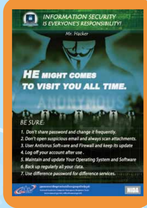
ស្គាល់ ប្រកាន់ខ្ជាប់ បន្ត