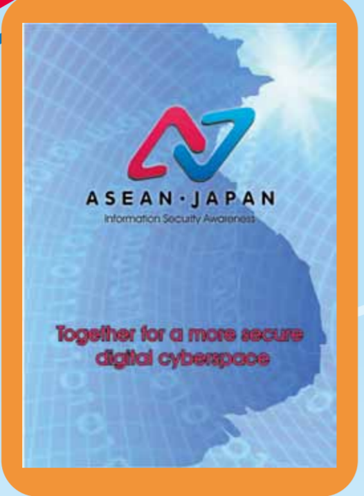
Hiểu biết, Bảo vệ, Cảnh giác