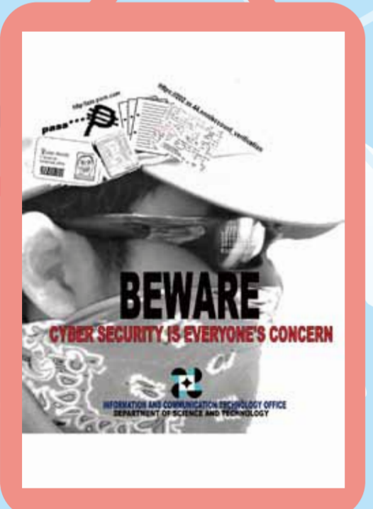
Alamin, Siguruhin at Maging Mapagmatiyag