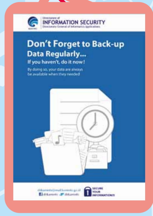
Mengetahui, Mengamankan, serta