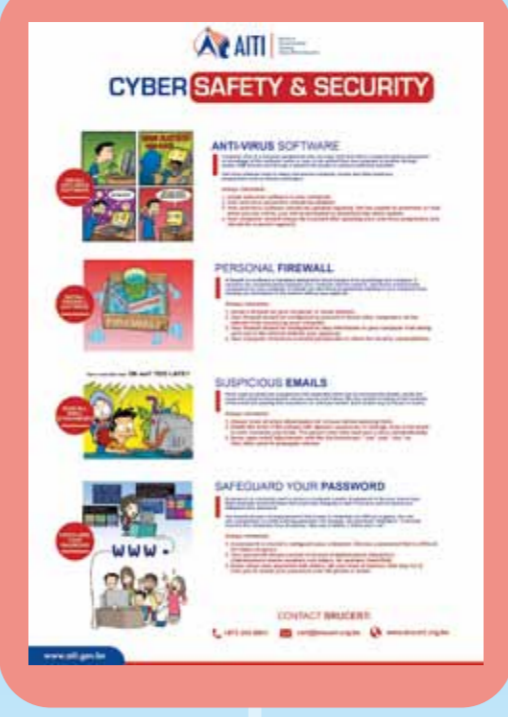
Peka, Selamat, Waspada