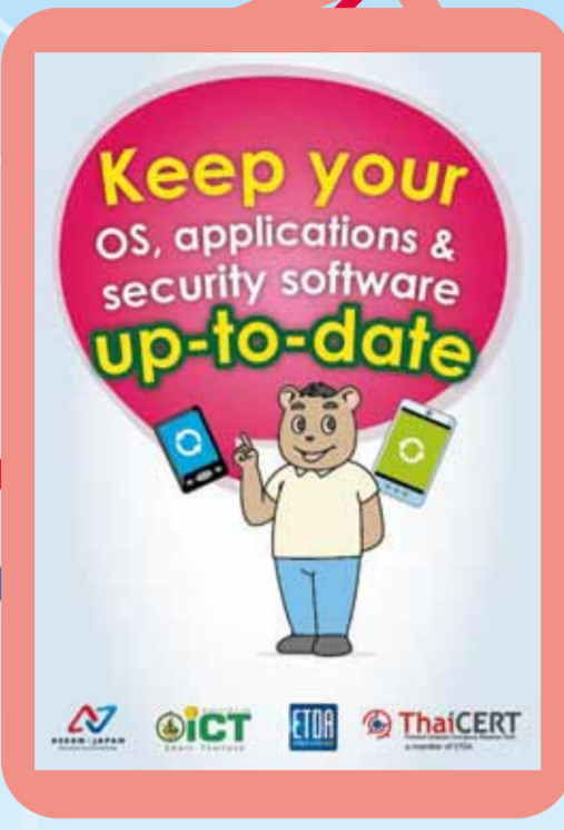
รู้ทัน, ป้องกัน, ทำต่อเนื่อง