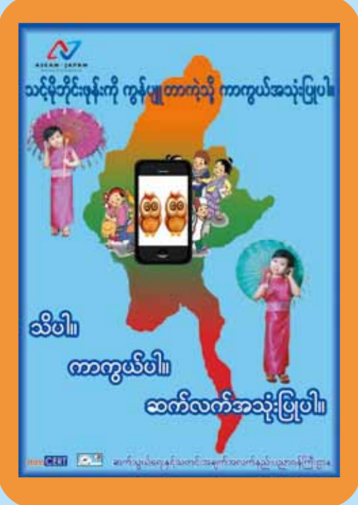
အသိ၊ လုံခြုံမှုနှင့် နိုးကြားမှု ရှိစေရန်