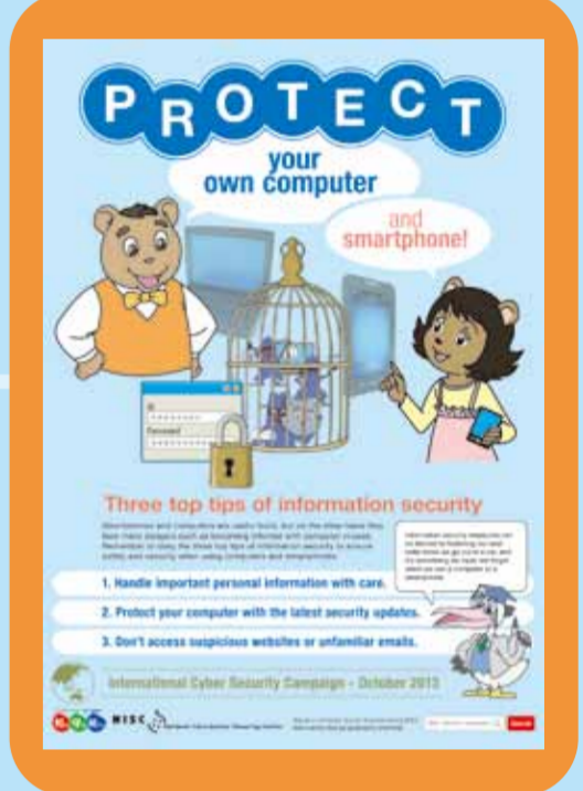
知る · 守る · 続ける