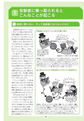
本ハンドブックの表紙及び内容一例