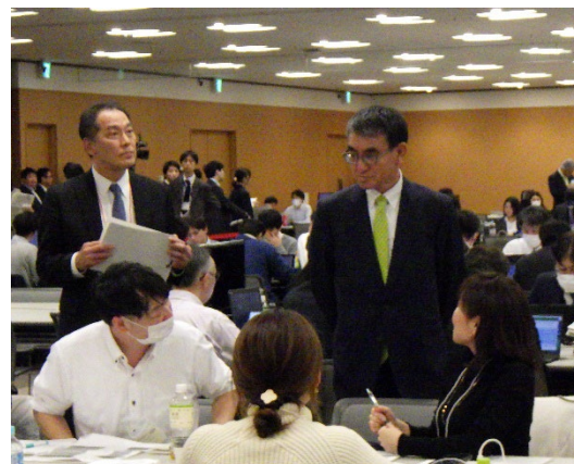
集合会場視察の様子