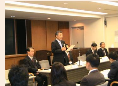
松本内閣官房副長官挨拶