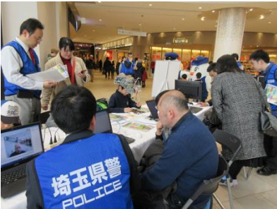
大型商業施設等における 実機を用いた不正プログラム 感染被害体験イベント