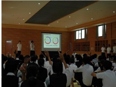
県警からの委嘱を受けた サイバー防犯ボランティア による活動