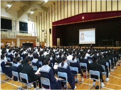
小・中・高校生を対象とした 情報セキュリティ講演 (ネット安全セミナー等)