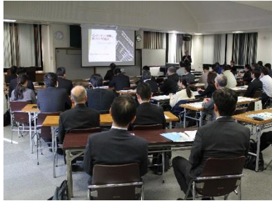
民間事業者等を対象とした 普及啓発セミナー