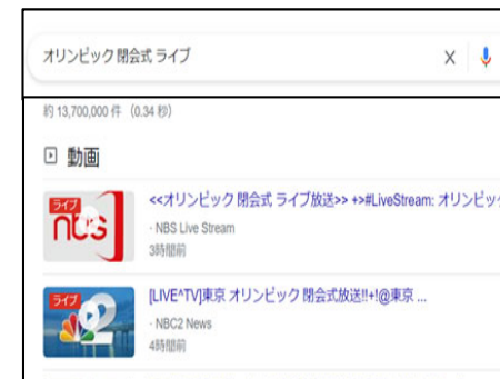
動画配信サイトの検索結果