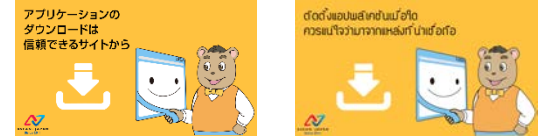
例) 左：日本語版，右：タイ語版