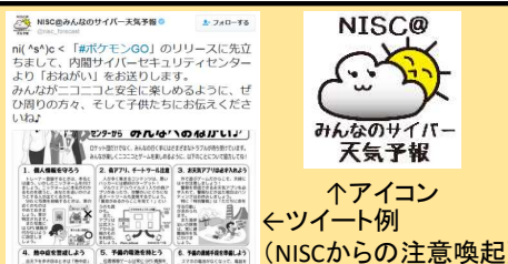
↑アイコン ←ツイート例 (NISCからの注意喚起)

参考: みんなのサイバー天気予報 フォロワー 9,400以上(twitter)、63,000以上(LINE) ※平成29年3月24日時点