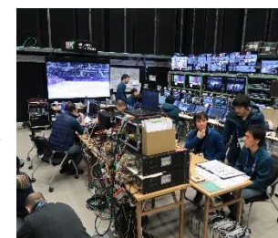
国際放送センター