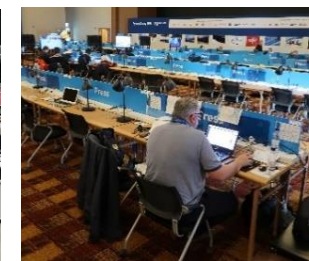
メインプレスセンター