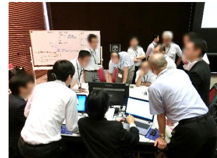
インシデント対応の検討状況