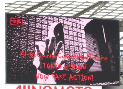
大型スクリーンに表示された改ざん画像