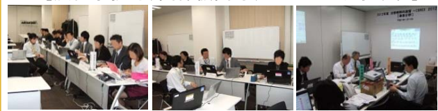
[演習事務局、関係機関等、コントローラ事業者]

・演習事務局は、各種障害状況、攻撃状況等を“メール”で付与する。 ・関係機関、コントローラ事業者は、“メール”又は、“掲示板(仮想HP)”でシナリオに則した関連情報の提供と共に、プレイヤー(事業者等)からの問合せ対応等もおこなう。