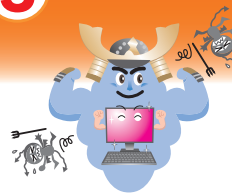
ウイルス対策ソフト

ウイルスに感染しないように、コンピュータにウイルス対策ソフトを導入しましょう。(家電量販店などで購入できます)