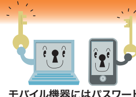
モバイル機器にはパスワード

大切な情報を保存したパソコン、スマートフォンなどを自宅から持ち出すときは機器やファイルにパスワードを設定し、なくしたり盗まれないように注意して持ち歩きましょう。