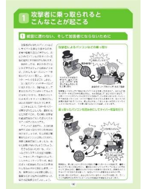
本ハンドブックの表紙及び内容一例