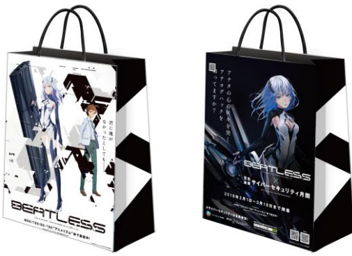
紙袋イメージ（表裏）