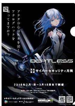
A4 クリアファイルイメージ