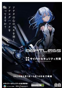
ポスターイメージ