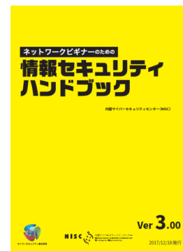
ネットワークビギナーのための情報セキュリティハンドブック