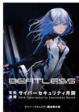
調査報告書イメージ