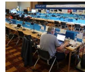
メインプレスセンター