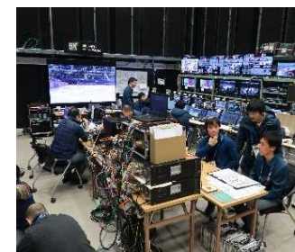
国際放送センター