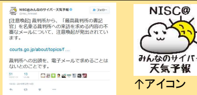
↑ツイート例（裁判所からの注意喚起）

〔実績：フォロワー 2,600以上（twitter）、26,000以上（LINE）。官公庁の注意喚起や、協力機関のセキュリティ情報を発信。〕